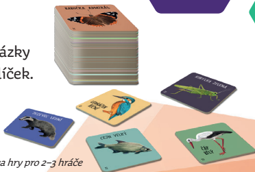
Příprava hry pro 2–3 hráče